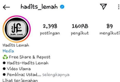
Gambar 1. Akun @hadits_lemah

fokus kajiannya adalah pada hadis-hadis sahih saja, sehingga kombinasi kedua akun ini memberikan perspektif yang luas bagi para pengikutnya. Dengan kontennya yang terstruktur, membuat akun @hadits_lemah ini semakin dikenal di masyarakat.