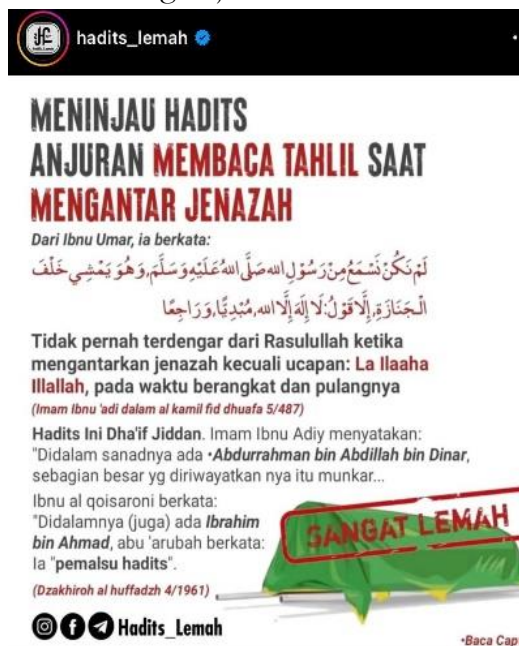
Gambar 5. Konten Hadis