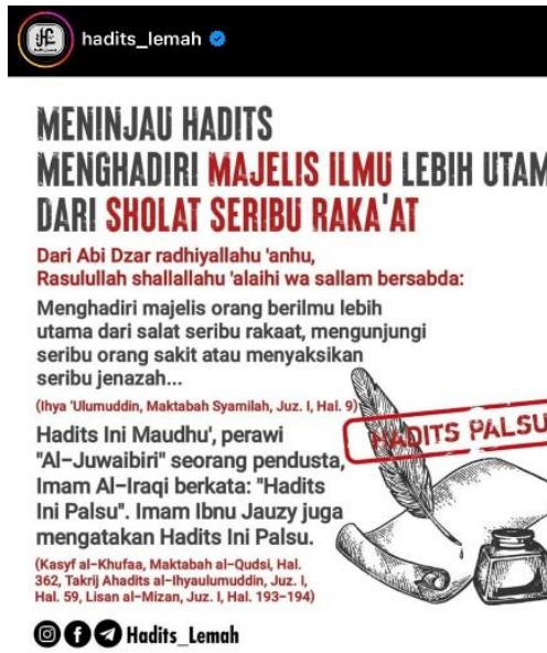
Gambar 3. Konten Hadis