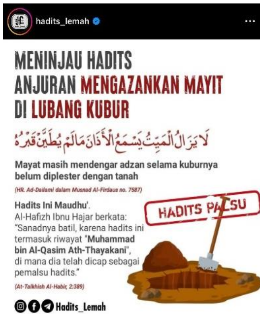
Gambar 7. Konten Hadis