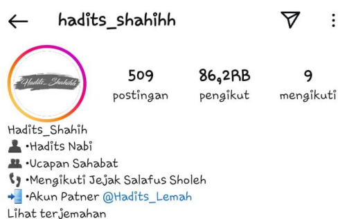
Gambar 2. Akun @hadits_shahih

Kedua akun di atas kerap membagikan video dakwah dari berbagai ulama ternama dari Timur Tengah, salah satunya adalah seperti Syekh Utsman al-Khamis. Beliau dikenal sebagai ulama kontemporer yang banyak mengkritik ajaran Syi'ah Imamiah, Syekh Utsman juga aktif menulis buku yang membantah pandangan Syi'ah. Materi dakwahnya sering membahas isu akidah dan perbandingan agama. 11 Ulama lainnya adalah seperti Syekh Sa'ad Al-Khotslan, beliau merupakan seorang profesor fiqih di Universitas Al-Imam di Riyadh. Selain itu, Syekh Sa'ad juga mengajar di Masjidil Haram, Mekah, beliau sering membahas isu-isu fiqih kontemporer dalam dakwahnya. Keilmuan beliau dikenal mendalam, khususnya dalam bidang hukum Islam. 12