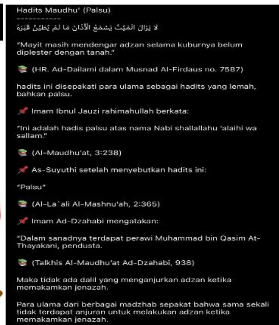
Gambar 8. Konten Hadis

Dalam pandangan mazhab Syafi'iyah, adzan tidak hanya dikhususkan sebagai panggilan untuk melaksanakan shalat, namun juga memiliki fungsi yang lebih luas dan dianjurkan dalam berbagai situasi tertentu di luar konteks shalat. Banyak ulama Syafi'iyah dalam kitab-kitab mereka menyebutkan bahwa adzan dapat dikumandangkan untuk kebutuhan lain, seperti saat terjadi kebakaran atau untuk mengiringi keberangkatan seorang musafir. Syekh Zainuddin al-Malibariy, seorang ulama Syafi'iyah terkenal dari India, dalam kitabnya Fath al-Mu'in , menjelaskan bahwa terdapat beberapa situasi di mana adzan dianjurkan. 24 Beliau menuliskan: