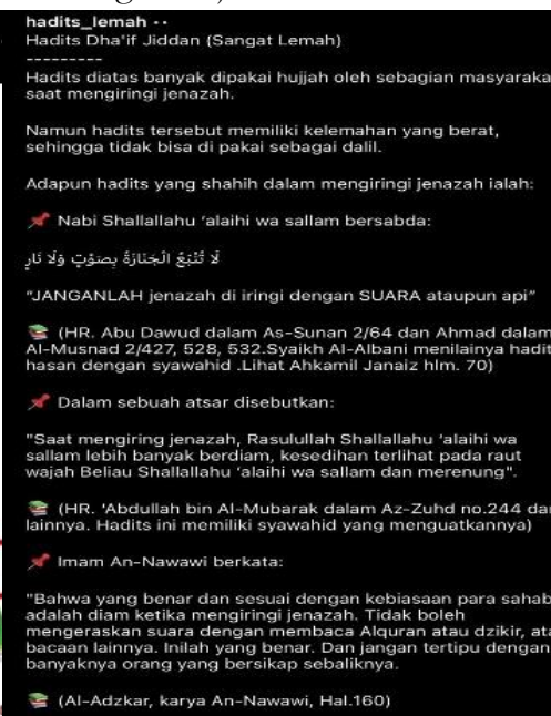
Gambar 6. Konten Hadis

Tradisi membaca tahlil ketika mengantarkan jenazah telah lama menjadi bagian yang tak terpisahkan dari kehidupan masyarakat Indonesia secara turun temurun. Namun, akun @hadits_lemah mengunggah sebuah postingan yang membahas hadis yang sering dijadikan dalil dalam pelaksanaan amaliyah ini dengan memberikan klaim bahwa kualitas hadis tersebut adalah daif (lemah). 23 Postingan yang mendapatkan 781 like tersebut tampaknya bertujuan untuk memengaruhi pandangan masyarakat agar tidak lagi mengamalkan tradisi ini. Hal ini tentu memicu reaksi pro-kontra di kalangan warganet, terutama dari kalangan masyarakat yang telah melestarikan tradisi ini secara turun temurun, karena tradisi ini telah menjadi bagian penting dari budaya dan praktik keagamaan mereka.